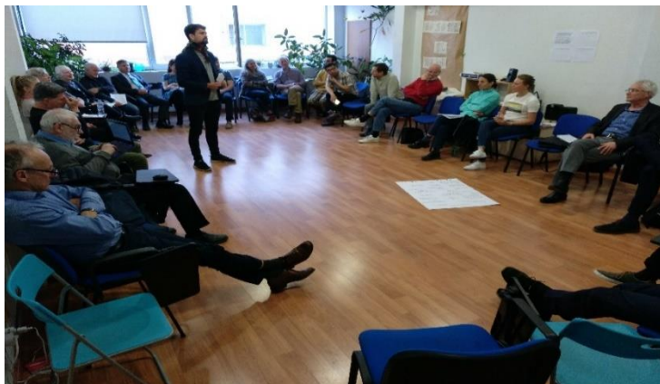
KUVA 2: KESKUSTELUA JOHTAJATAIDOISTA

Perjantain tutustumispainotteinen ohjelma jäi valitettavasti välistä, mutta kuulin etenkin muiden maiden tilanteesta kattavasti muun ohjelman ohessa. IMMR on siis hiljattain perustettu kattojärjestö samaa asiaa ajaville kansallisille järjestöille. Pisimmällä ollaan ehkä Hollannissa, jossa parlamentin tieteellinen neuvosto on suosittanut keskuspankkitilien avaamista kansalaisille. Myös Tanskassa kansallisen järjestön toiminta on viikoittaista ja heillä on noin 100 000 tilaajaa sähköpostikirjeelleen. Mm. näissä maissa ja etenkin Englannissa järjestöillä on palkattuja työntekijöitä ja aktiivista poliittista lobbaustoimintaa.