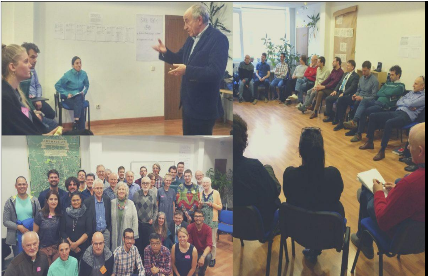
KUVA 1: YLHÄÄLLÄ VASEMMALLA: KESKUSPANKKIIRI FERNÁNDEZ ORDÓÑEZ PITÄMÄSSÄ LUENTOA ALHAALLA VASEMMALLA: 30 OSALLISTUJAA YMPÄRI MAAILMAA OIKEALLA: Keskustelua digitaalisen käteisen mahdollisuuksista