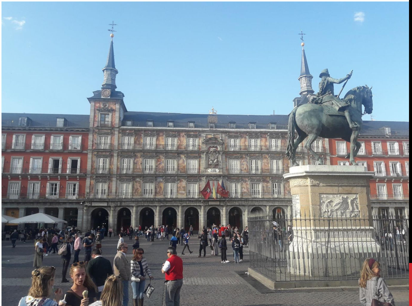
KUVA 4: MADRIDIN KESKUSTAA